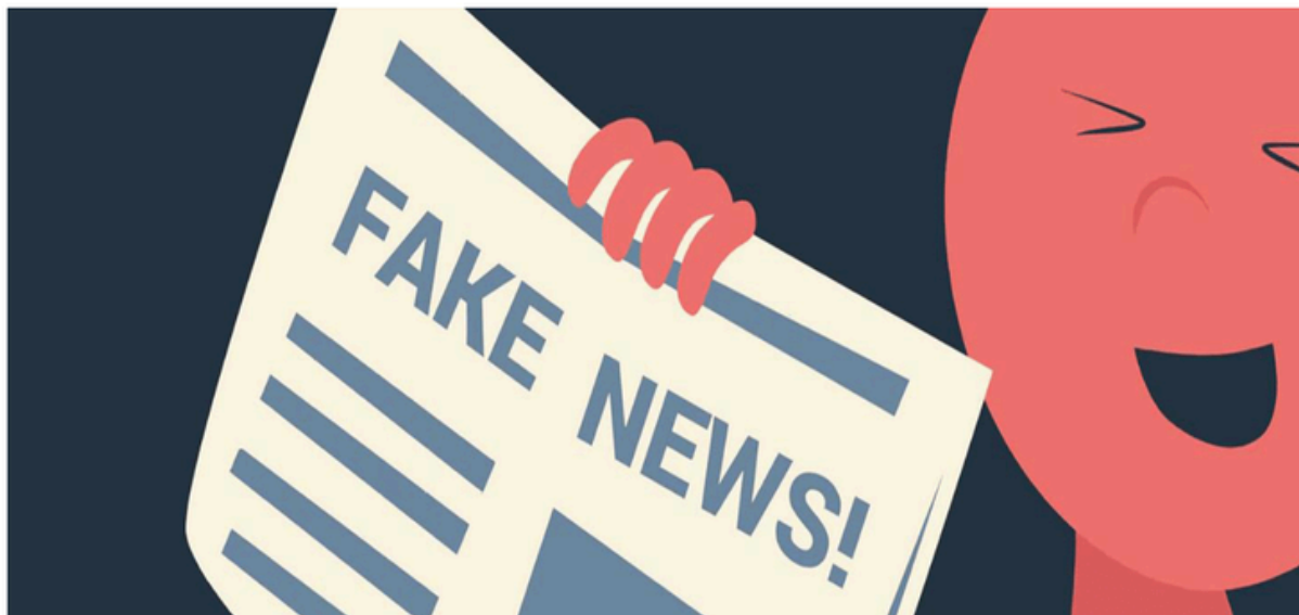
Figura 1: Representação da Fake News. Disponível em: https://betbonus.xyz/bet/mostpopular .

Enigma: A vida na cultura digital sempre está permeada por práticas de risco e oportunidades. Mesmo um “Google” da vida pode nos levar a ciladas que não percebemos, como notícias falsas. Como a educomunicação pode nos ajudar nisso?