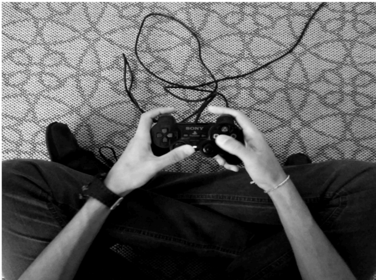
Figura 1: O vídeo game e sua influência.

Enigma: "Os jogos sempre trouxeram uma característica de aprimorar e estimular estratégias, principalmente no imaginário infantil. Mas a linguagem agressiva e com o teor de violência sempre foi presente nos games, como utilizar o paradigma de Educomunicação em tal situação vigente?"