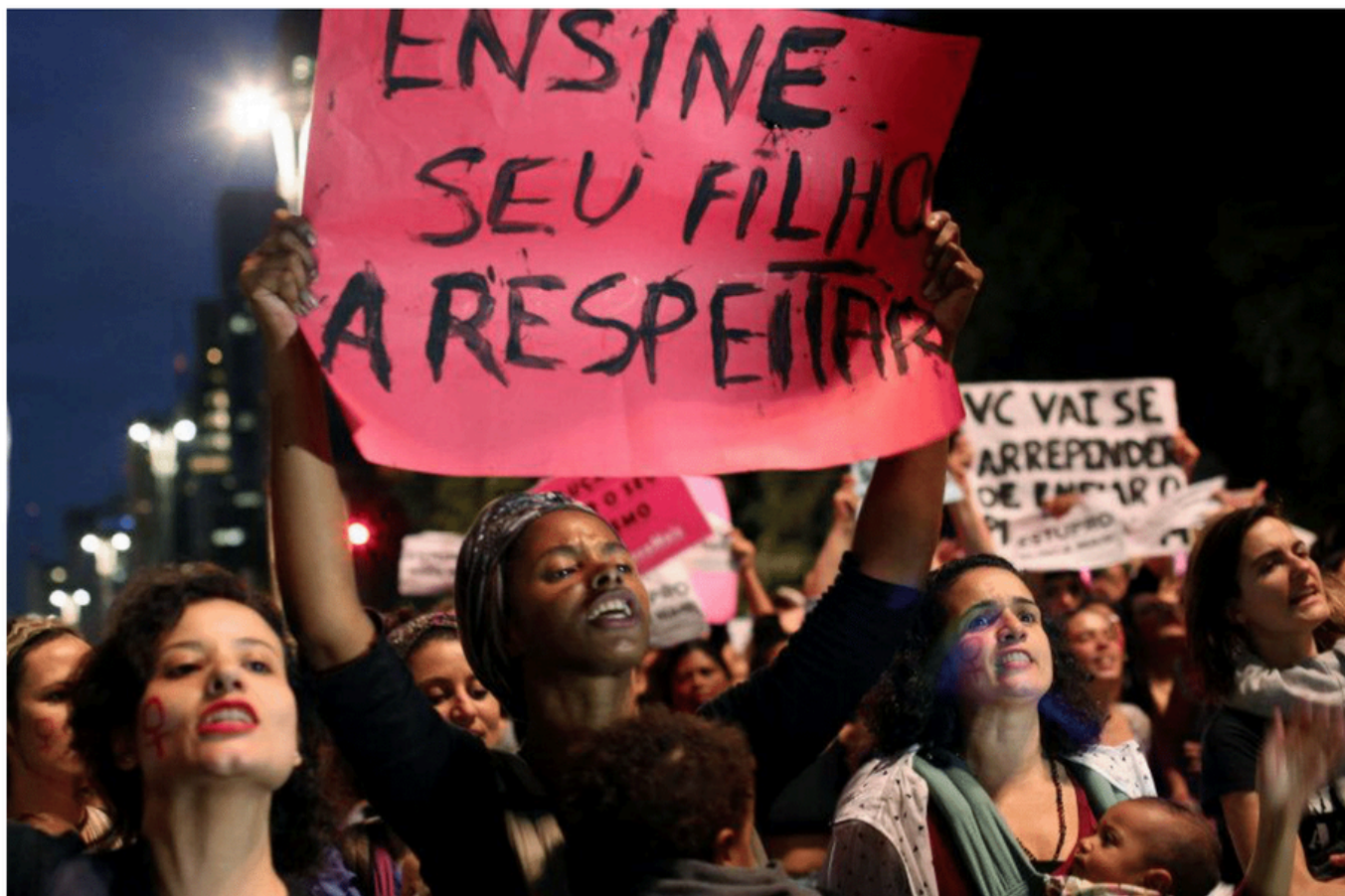
Figura 1: Manifestação em São Paulo contra estupro coletivo de adolescente no Rio de Janeiro.

Por Bruna Garcia Kuba e Caroline Peralta Kazanji*