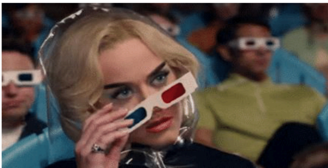
Figura 2: Imagem retirada do Vídeo clipe Chained To The Rhythm da cantora norte-americana Katy Perry em seu canal Vevo no Youtube.

Além disso, deve-se considerar que cada espectador interpreta as informações recebidas através dos filmes de forma diversa. Weber afirma que “ o evento está condicionado pela orientação do nosso interesse de conhecimento, e essa orientação define-se conforme o significado cultural que atribuímos ao evento em questão em cada caso particular ”. Portanto, a violência assistida no cinema pode ser recebida pelo público em diferentes intensidades, sendo projetada de acordo com a vivência e valores de cada indivíduo.