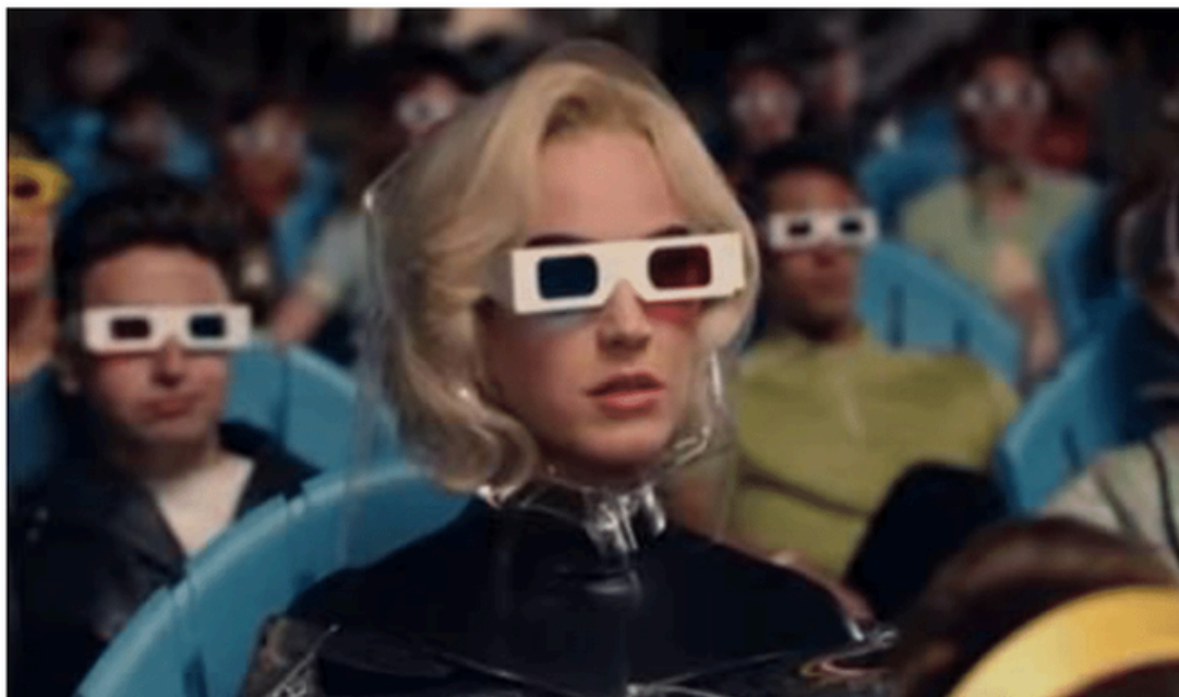
Figura 1: Imagem retirada do Vídeo clipe Chained To The Rhythm da cantora norte-americana Katy Perry em seu canal Vevo no Youtube.

“A maior parte de nós conhece e teme a tortura e a cultura do terror unicamente através das palavras dos outros. Por isso preocupo-me com a mediação do terror através da narrativa e com o problema de escrever eficazmente contra o terror” Michael Taussig- Xamanismo, colonialismo e o homem selvagem.”